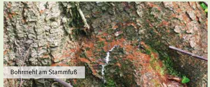
Bohrmehl am Stammfuß

Bei liegendem Holz, das nicht rechtzeitig abgefahren, entrindet oder anderweitig vor massivem Käferbefall geschützt werden kann, ist nach Abwägung aller alternativen Möglichkeiten der Einsatz von Pflanzenschutzmitteln (PSM) als letztes Mittel manchmal unumgänglich (Voranflugbehandlung). Hierbei kann das Holz entweder mit einem Insektizid behandelt oder mit einem Kunststoffnetz abgedeckt werden, das einen insektiziden Wirkstoff enthält (Storanet®). Bei beiden Methoden werden an das Holz bzw. Storanet® anfliegende Käfer durch die Kontaktwirkung des Insektizids abgetötet.