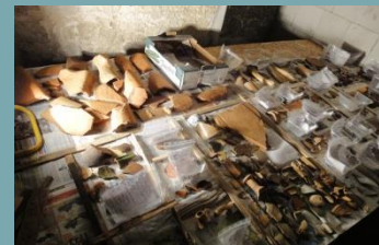
Funde aus dem Mittelalter