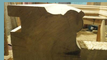
Künftiges Fenstergewände aus Eiche