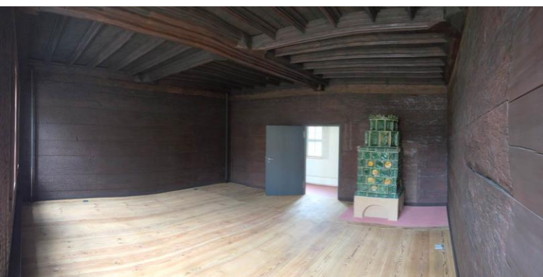
Die historische Bohlenstube