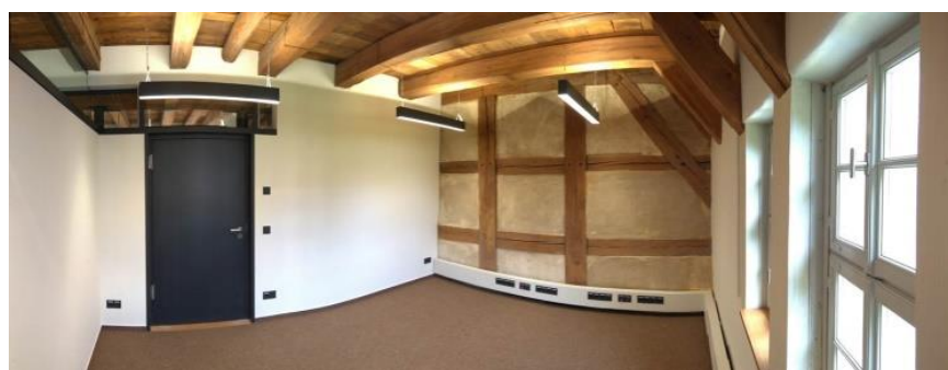
Büroansicht im Obergeschoss