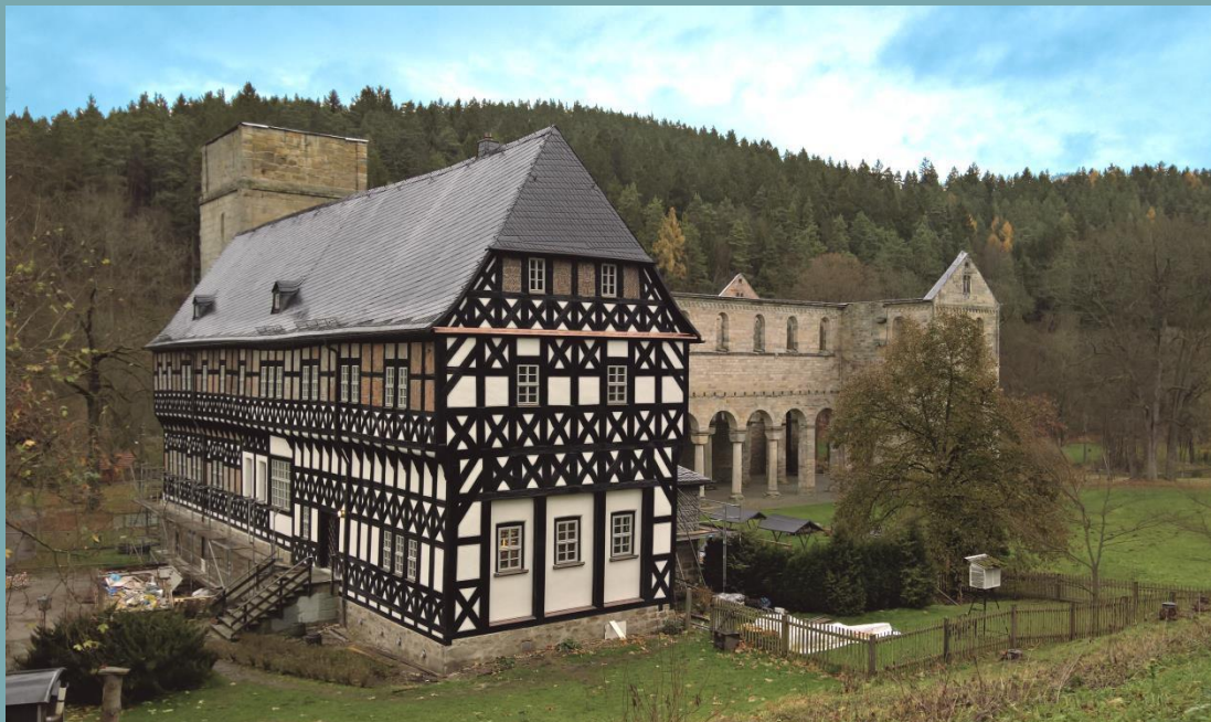
Das denkmalgeschützte Amtshaus erstrahlt nun neu

Nach fast acht Jahren Konzeptions- und Umsetzungsarbeit „Sanierung Amtshaus Paulinzella“ erfolgte am 15. Juni 2018 die feierliche Schlüsselübergabe durch den Thüringer Ministerpräsidenten. Somit wird mit einer vierjährigen Pause wieder eine ländliche Region in Thüringen mit einem Forstamt ausgestattet. Die umfangreiche Sanierung erlaubt ein umfassendes Holzerlebnis. Die herrliche Holzverwendung der Außenfassade ist auch im Innenbereich erlebbar. So ist der faszinierende Baustoff Holz, unser Hauptprodukt, auf „Schritt und Tritt“ für künftige Mitarbeiter/-innen und Gäste „greifbar“. Die Holzverwendung und -gestaltung wird in den elf Büroeinheiten, am Beispiel der innovativen Treppengestaltung in Kombination Eiche und Stahl sowie an Hand architektonisch anspruchsvoller Innengestaltung mit viel Glas einen jeden erstaunen. Bauzeitlich korrekt wird nach 543 Jahren wieder dieser herrliche Rohstoff „ Weißtanne “ als Ausgangsmaterial für den Innenausbau verwendet. Eingeschlagen in Baden – Württemberg in der Nähe des Mutterklosters Hirsau. Für uns Förster eine Motivation, auch künftig diese fast vergessene Baumart engagiert in den Thüringer Wäldern zu fördern.