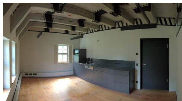
Der Besprechungsraum im Obergeschoss